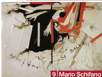
9 Mario Schifano