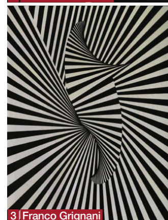
3 Franco Grignani