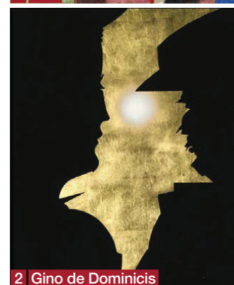
2 Gino de Dominicis