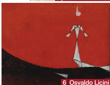
6 Osvaldo Licini