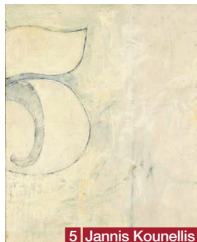
5 Jannis Kounellis