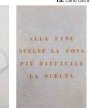
17. Piero Dorazio 112.500