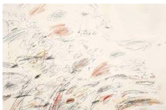
1. Cy Twombly 2.772.500