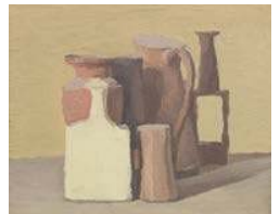
4. Giorgio Morandi 1.068.500