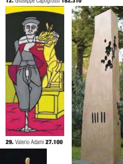
29. Valerio Adami 27.100