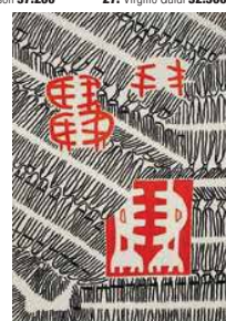
12. Giuseppe Capogrossi 182.310