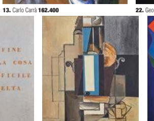
19. Vincenzo Agnetti 87.600