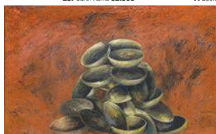
30. Giuseppe Gallo 24.700