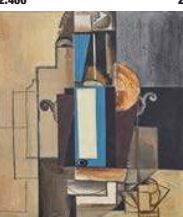
18. Giorgio de Chirico 87.600