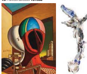
14. Giorgio de Chirico 150.000