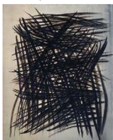
8. Hans Hartung 350.000