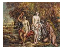
18. Giorgio de Chirico 87.600