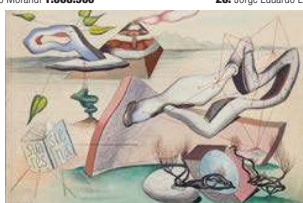
15. Frantisek Janousek 137.500