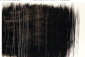
25. Hans Hartung 37.500