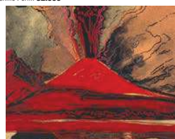
24. Andy Warhol 44.640