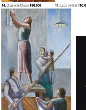
13. Carlo Carrà 162.400