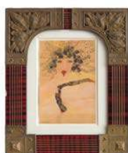
23. Carol Rama 62.500