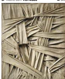
5. Salvatore Scarpitta 732.500