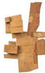
6. Robert Rauschenberg 628.400