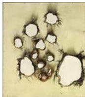
3. Alberto Burri 1.574.800