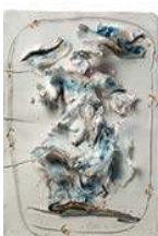
7. Lucio Fontana 512.500