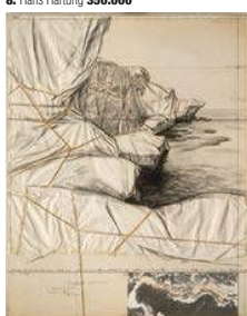
20. Christo 74.420