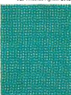
17. Piero Dorazio 112.500