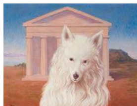
2. René Magritte 1.625.000